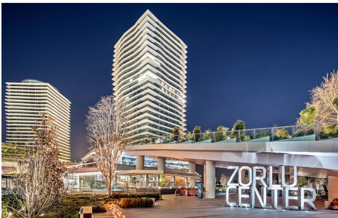
↳ 高級莫名的Zorlu Center 是個複合式購物中心兼大型展演廳（圖片：官網）

買眼鏡相關的要 go Optik，我偏愛大型連鎖感覺可以信任的Atasun，鞋子的話 FLO有Outlet可以超便宜解決。Taksim 獨立大街分支的小巷裡其實有些二手衣物店，或是Karaköy的小巷弄裡也有，二手店大部份都不能刷卡喔（或是多收手續費）。